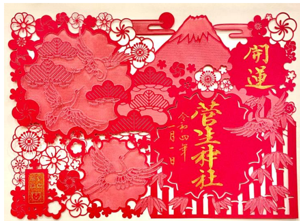
お正月切り絵御朱印（赤色）