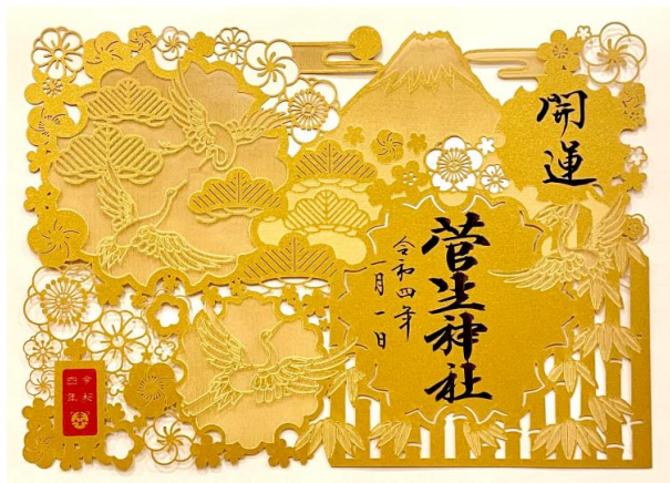
お正月切り絵御朱印（金色）