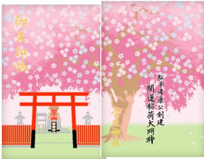
大判特別御朱印帳