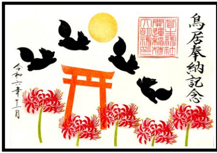
特別御朱印（書置き）