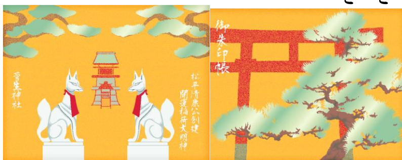
見開き特別御朱印帳